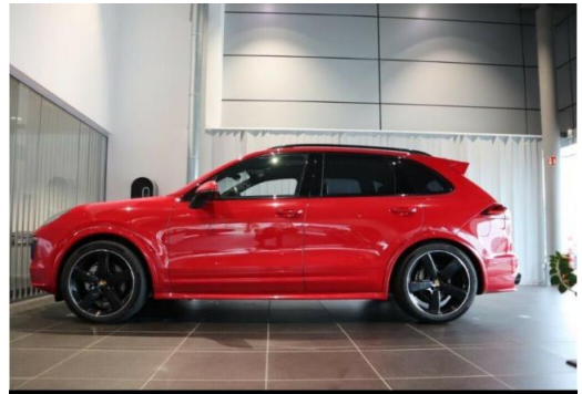
Porsche Zentrum Hegau-Bodensee