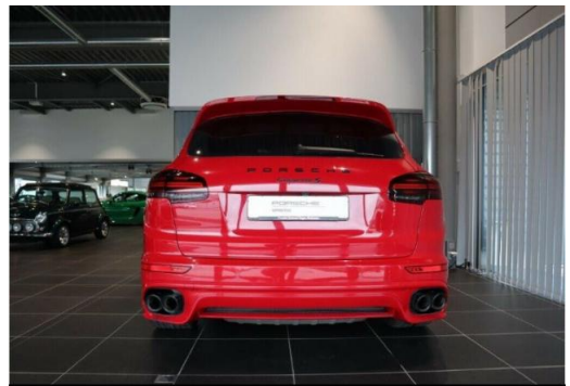
Porsche Zentrum Hegau-Bodensee