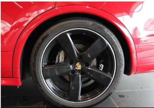
Porsche Zentrum Hegau-Bodensee