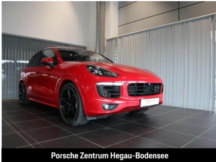
Porsche Zentrum Hegau-Bodensee