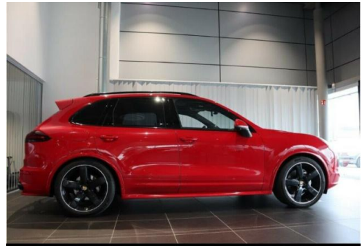
Porsche Zentrum Hegau-Bodensee