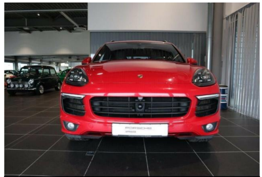
Porsche Zentrum Hegau-Bodensee