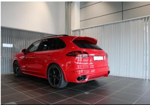
Porsche Zentrum Hegau-Bodensee