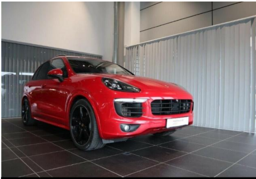
Porsche Zentrum Hegau-Bodensee