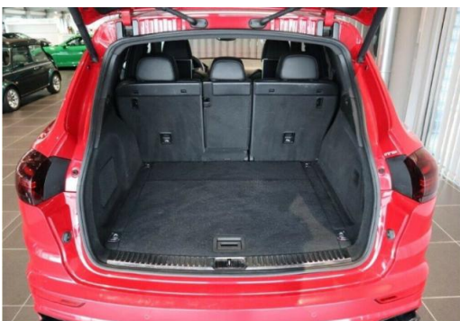
Porsche Zentrum Hegau-Bodensee