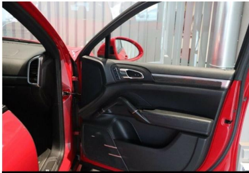
Porsche Zentrum Hegau-Bodensee