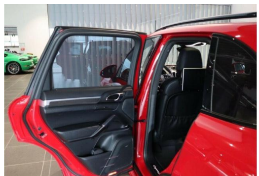
Porsche Zentrum Hegau-Bodensee